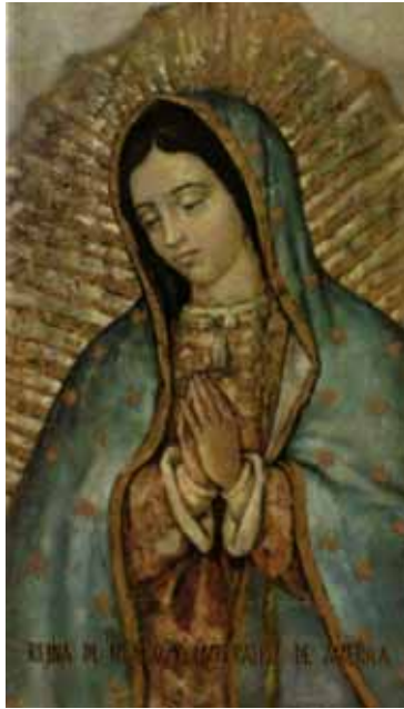
Maria Santissima Nostra Signora di Guadalupe